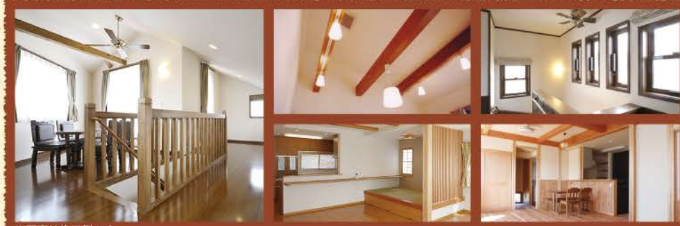
※写真は施工例です。

見学会会場で同時開催! 100宅地大商談会 【10月23日(日)限定】 協賛:オビワン不動産(株)