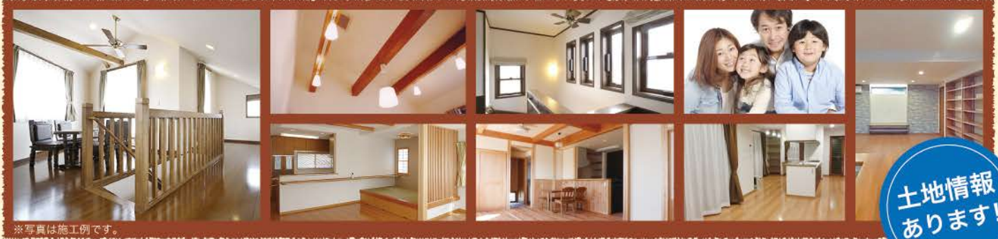
※写真は施工例です。